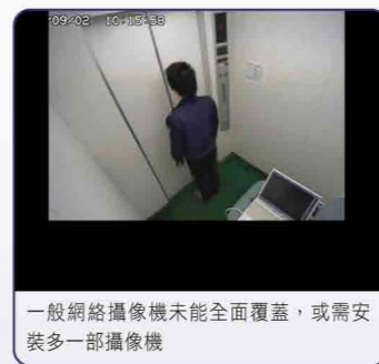
一般網絡攝像機未能全面覆蓋，或需安裝多部攝像機

104°廣角鏡頭視野廣闊，部份型號更可調較鏡頭角度，進一步增大監察範圍。特別鏡頭設計及技術，有效減少邊緣的影像變形。