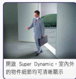
開啟 Super Dynamic，室內外的物件細節均可清晰顯示