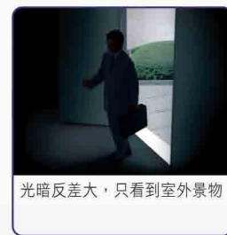
光暗反差大，只看到室外景物