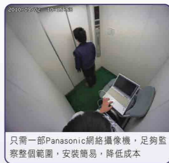
只需一部Panasonic網絡攝像機，足夠監察整個範圍，安裝簡易，降低成本